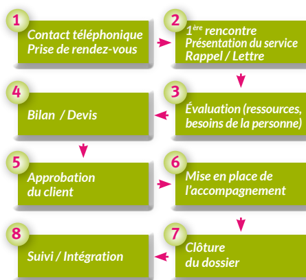
Le déroulement de la prise en charge

Aujourd'hui, Réhalto dispose d'un réseau de 1500 spécialistes répartis sur l'ensemble des territoires français et belge. Ces intervenants présentent des profils complémentaires puisqu'on y trouve des cliniciens, des psychologues du travail, des conseillers professionnels, des ergonomes, des ergothérapeutes, des thérapeutes corporels... Dans tous les cas, la prise en charge s'effectue selon une méthodologie éprouvée comprenant 8 étapes distinctes.