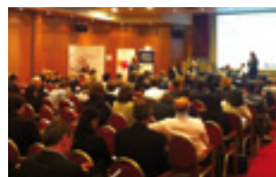
De nombreux DRH ont répondu présent à l'invitation