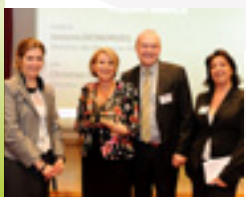
Remise du Prix de l'Innovation à Agricola

intervient en tant qu'expert dans les nombreux ateliers organisés mensuellement.